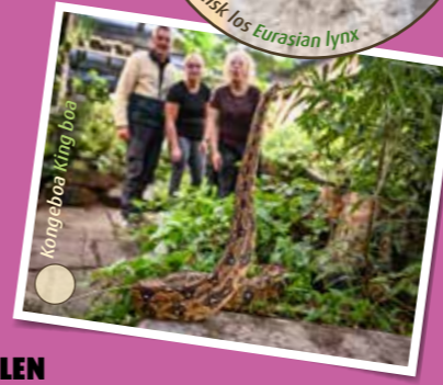
Kongebaa King cobra