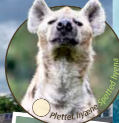
Plettet hyæne Spotted hyena