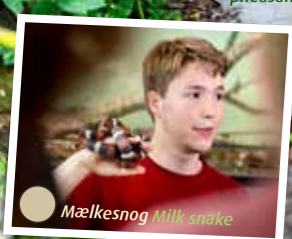
Mælkesnog Milk snake