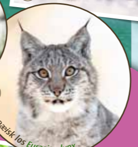
Europæisk los Eurasian lynx