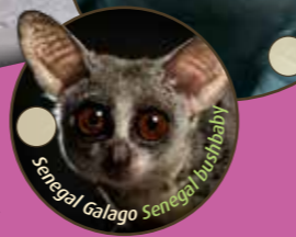
Senegal Galago Senegal bushbaby