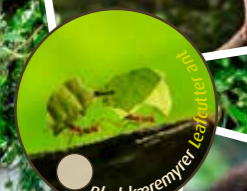
Bladskæremyrer Leaf-cutter ant