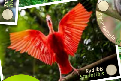
Rød ibis Scarlet ibis