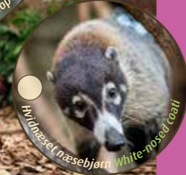
Hvidnæset næsebjørn White-nosed coati