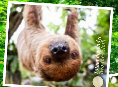
Toldele dyr Two-toed sloth