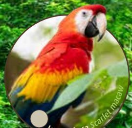
Lyserød ara Scarlet macaw