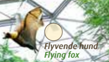
Flyvende hund Flying fox