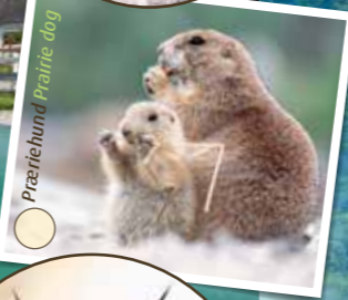
Præriehund Prairie dog